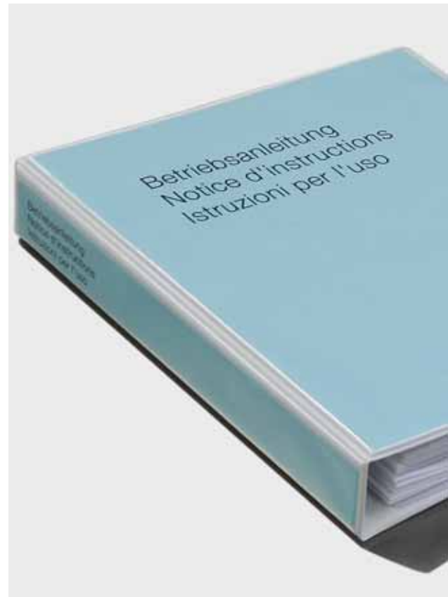
2 Esempio di un manuale di istruzioni

Se si acquista una macchina da un fabbricante o importatore svizzero, provare la sua sicurezza è semplice. Infatti, il responsabile dell'immissione in commercio è tenuto per legge a fornire assieme alla macchina anche una dichiarazione di conformità 1 . Questa attesta che la macchina è conforme ai requisiti della Direttiva macchine 2006/42/CE 2 . Egli deve fornire anche le istruzioni per l'uso nella lingua richiesta (figure 1 e 2).